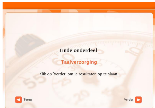
Voorbeeld van einde-onderdeel-scherm