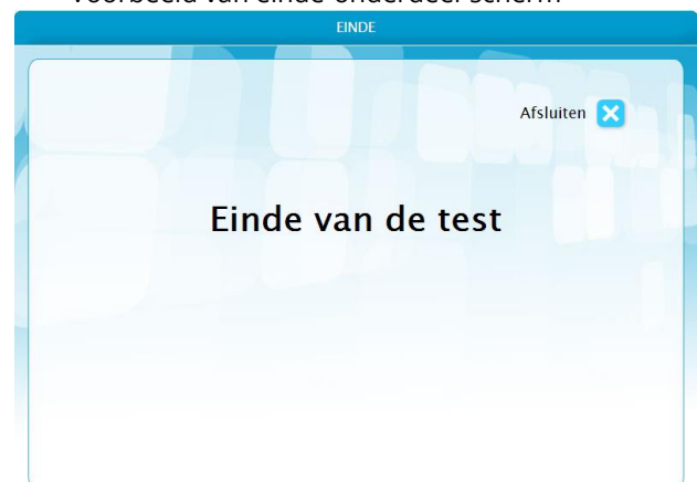
Voorbeeld van het laatste sluitscherm