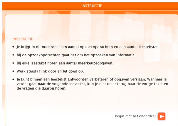
Voorbeeld van instructiescherm

Hieronder zie je voorbeelden van instructie- en eindschermen.