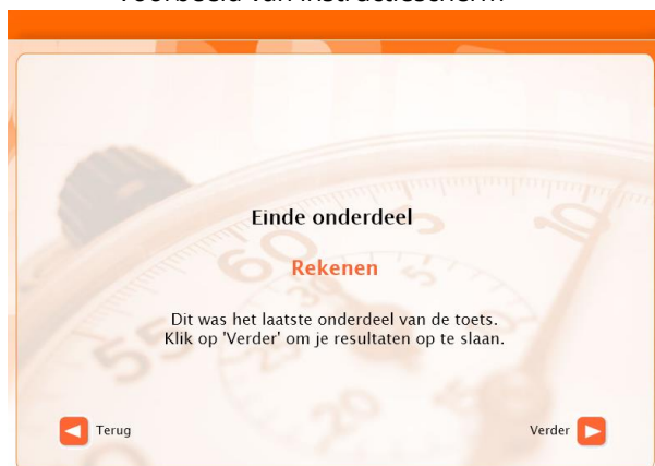
Voorbeeld van einde-scherm laatste onderdeel